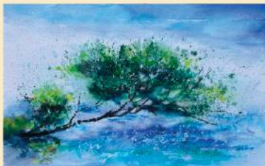
Une peinture de sa chère Rosa

jeux d'eau signés de Christophe Jublin ont illustré les enregistrements sublimes de ses plus grands succès : (La Gioconda, Madame Butterfly, Lucia de Lamermoor et bien sûr Tosca ...), qu'accompagnaient de très belles photos des temps forts de sa vie.